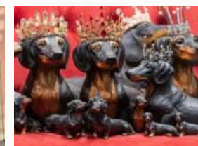
Über 5000 Ausstellungs Exponate im Museum