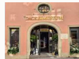
Eingang zum historischen Dackelmuseum

Wir fahren im modernen Drusberg-Car via Linthgebiet - Rheintal - Allgäu - München nach Regensburg. Zimmerbezug im Dream Inn Hotel Regensburg. Im Anschluss haben wir eine exklusive Führung durch das weltberühmte Dackelmuseum, mit über 5000 Exponaten auf 200qm. Parallel findet eine Hunde-Stadtführung durch Regensburg statt. Anschließend genießen wir gemeinsam ein fakultatives Abendessen im Gasthaus Spitalgarten.