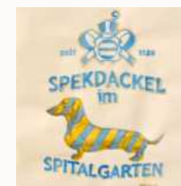
Gasthaus Spitalgarten Regensburg

Nach dem Frühstück begeben wir uns zum Treffpunkt für die Teilnahme an der Dackelparade, das HIGHLIGHT unserer Reise. Nach der Parade steht euch der Nachmittag/Abend zur freien Verfügung.