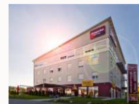
Dream Inn Hotel, Regensburg Ost

Und schon ist der Tag der Tage auch schon wieder da! Nach dem Frühstück ca. 10:30 Uhr begeben wir uns auf die Rückfahrt Richtung Schweiz.