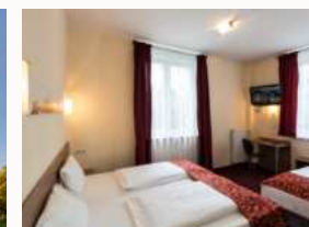
Zimmer, Dream Inn Hotel Regensburg Ost